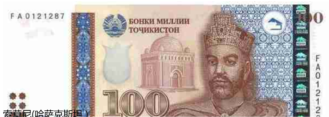
索莫尼(哈萨克斯坦)