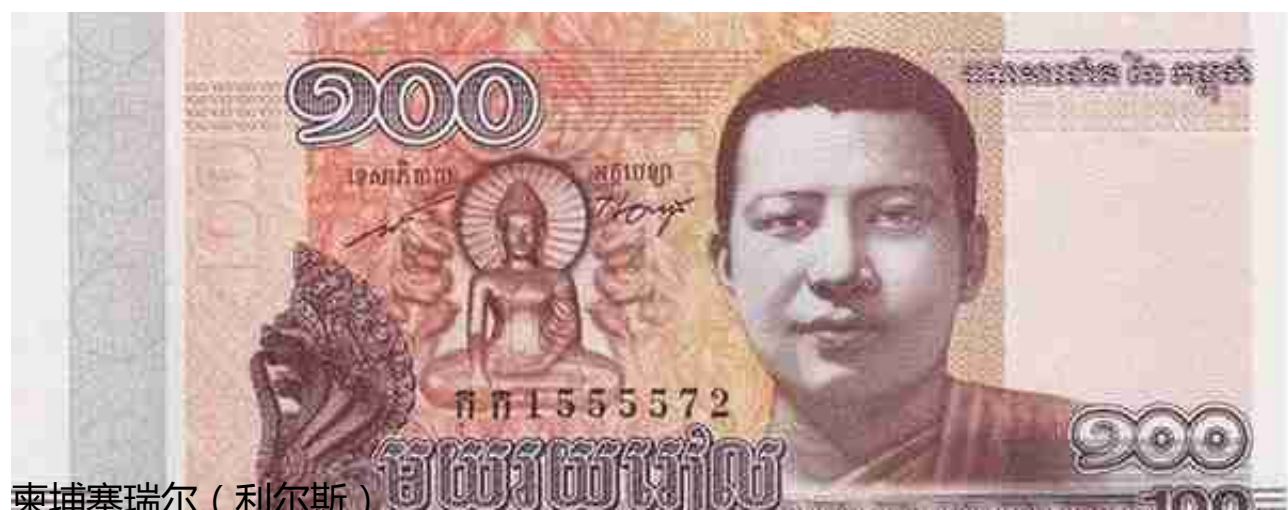
柬埔寨瑞尔 (利尔斯)