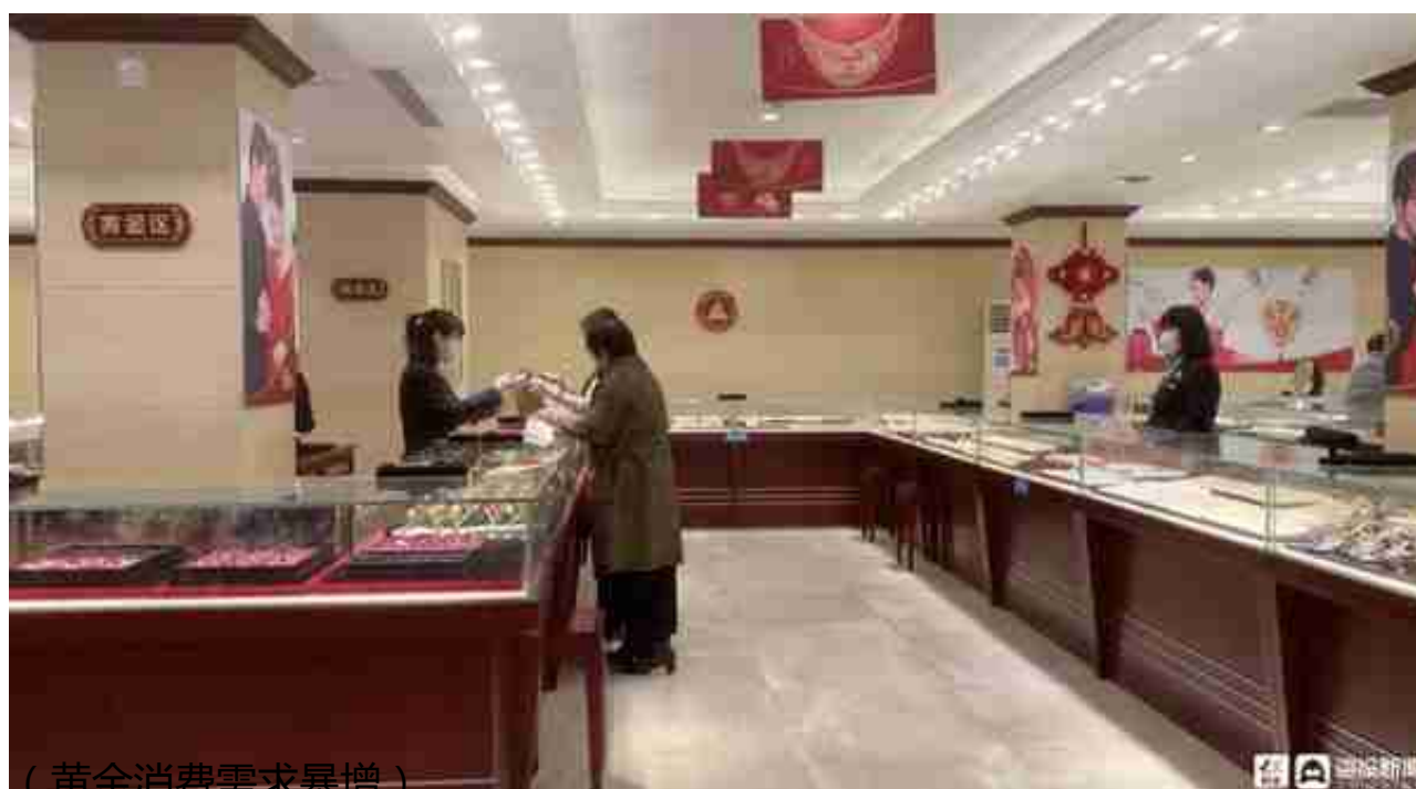
(黄金消费需求暴增)

3月1日，记者来到位于山东济南泉城路的齐鲁金店，看到店内黄金价格显示，黄金饰品价格为476元/克，投资金条价格为459元/克。